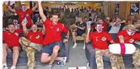
Tidak akan melepaskan sebarang perlawanan. (Pastikan anda hadir setiap acara).