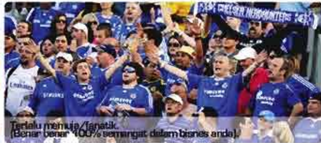
Terlalu memuja/Tanatik. (Benar benar 100% semangat dalam bisnes anda).