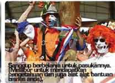
Selalu berbelanja untuk pasukannya. (Melabur untuk mendapatkan pengetahuan dan juga alat-alat bantuan bisnes anda).