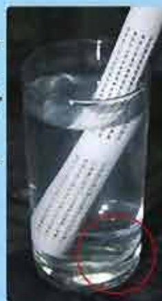
Partikel partikel putih adalah bahan semula jadi yang teroksida dengan Mg, dan ia terasing daripada permukaan stick atau bola seramik.

Tapi usah bimbang, ia lazim untuk berlaku dan anda boleh menggunakannya secara terus menerus selepas mencucinya dengan sebersihnya, dengan cuka. Fungsinya dalam menghasilkan air Anti-Oksidan akan kembali sama seperti kali pertama anda menggunakannya. Tetapi adalah lebih baik untuk menyimpan 'stick' dan bola mengikut penjelasan pada nombor 2.