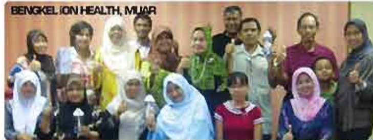
BENGKEL ION HEALTH, MUAR