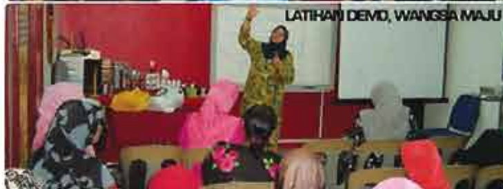
LATIHAN DEMO, WANGSA MAJU