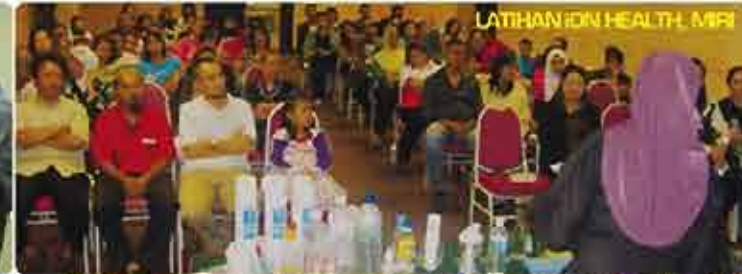
LATIHAN ION HEALTH, MIRI