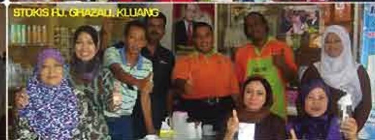
STOKS FU. GHAZALI, KLUANG