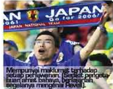
Mempunyai maklumat terhadap setiap perlawanan. (Seperti pengetahuan amat bahaya, berjajarah begalannya mengenai Revell).