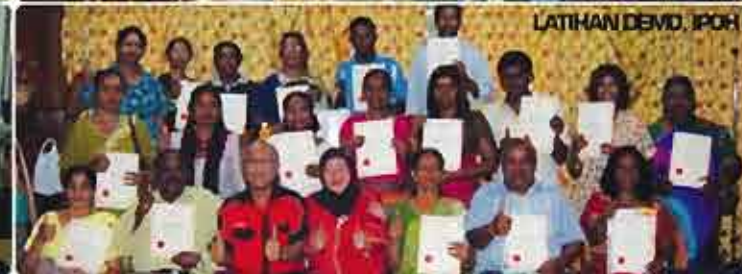
LATIHAN DEMO, IPOH