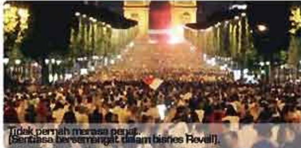
Tidak pernah merasa penat. (Sentiasa bersemangat dalam bisnes Revell).