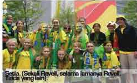
Setia. (Sekali Revell, selama lamanya Revell. Tiada yang lain).