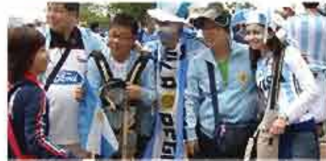
Tidak kira bila mereka akan pulang ke rumah. (Jangan pulang awal, bergaul dengan leader dan downtime anda selepas acara).