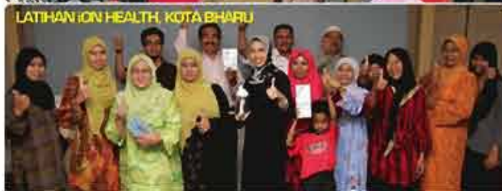
LATIHAN ION HEALTH, KOTA BHARU