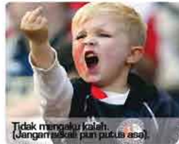
Tidak mengaku kalah. (Jangan sekali pun putus asa).