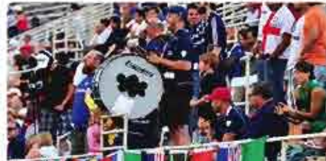
Mencari tempat duduk yang terbaik di hadapan. (Duduk di hadapan, jangan di belakang).