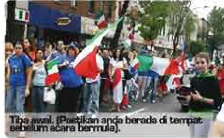
Tiba awal. (Pastikan anda berada di tempat sebelum acara bermula).