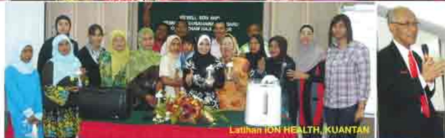
Latihan iON HEALTH, KUANTAN