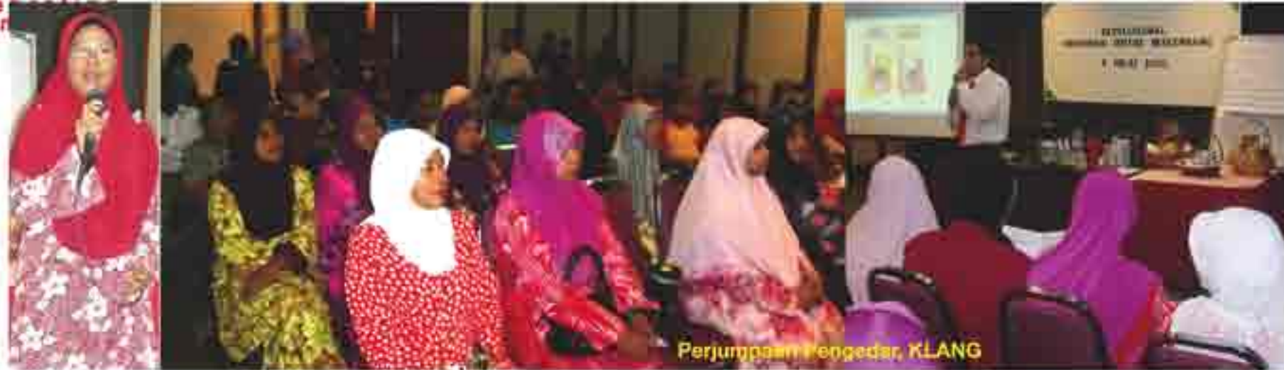
Perjumpaan Pengedar, KLANG